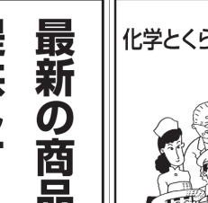
CFP算定システムユーザー会

CFP算定システムユーザー会 環境とビジネス両立へ CFP算定システムユーザー会は、環境とビジネスの両立を目指して活動している。最新の技術とノウハウを共有し、持続可能な社会の実現を目指す。