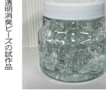
高効率でピーズに含浸

高効率でピーズに含浸 日本抗菌総研 家庭向け消臭剤開拓 日本抗菌総研は、家庭向けの消臭剤を開拓するために、高効率でピーズに含浸する技術を開発した。この技術は、家庭での消臭に大きく貢献する。